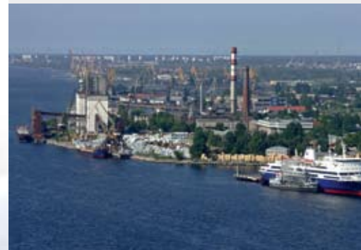
Строительство нового здания элеватора было завершено в 1984 году.